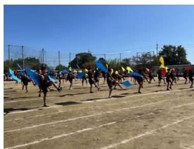
6年生、「心響（みおと）」という合言葉を大切にして練習を重ね、全身やフラッグを使ったダイナミックな演技は見る人の心にもしっかり響きました！