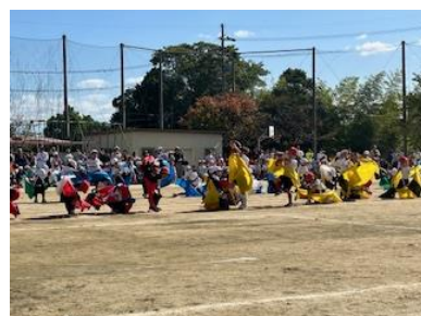
1年生、小学校で初めての運動会でしたが、思いっきり走ったかけっこ、元気いっぱい踊った荒馬、最後のポーズもバッチリ決まっていました！