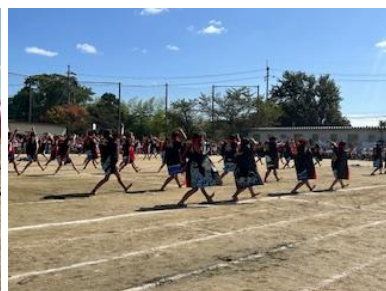
5年生、全員で心を一つに練習を重ね、一つ一つの動きが磨かれ、本番では力強い、迫力のあるソーランを見せてくれ、本当にかっこよかったです！