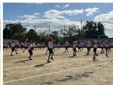
2年生、ポケモン、モンスターボールでしっかりゲットして力いっぱい走り、ダンスではかわいく、さらにかっこよく踊ることができていました！