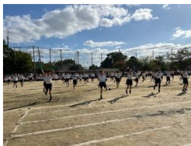
3年生、トップバッターで緊張したと思いますが、堂々とした踊りで、練習から本番まで楽しく取り組むことができた様子が伝わってきました！