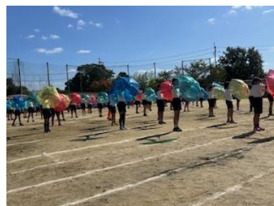
4年生、OneTeamを合言葉に色とりどりの傘を使っての表現、タイミングやスピードをそろえたところなど丁寧に取り組んできた成果が出ていました！