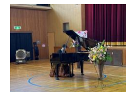
げんキッズ (ピアノコンサート)