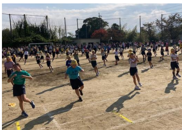
かっこよく、キレッキレのダンスは4年生。曲はCHOO CHOO TRAIN