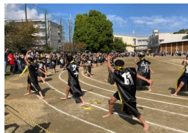
5年生は南中ソーラン。黒のはっぴに漢字一文字。力強く踊りました。