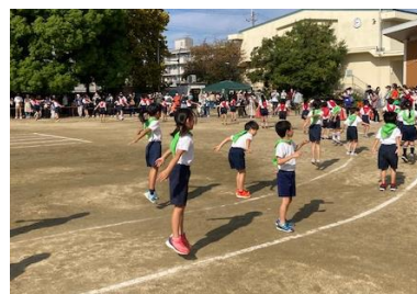
2年生の曲はツバメ。 かわいさも残る、にこにこのダンスです。