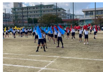
3年生。曲は新時代。マントをつけて、かっこかわいいダンスです。