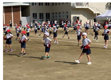
1年生は、UFO といけ！ いけぴっかぴかを踊ります。 みんなノリノリです

お家の方には、毎日の体操服やお茶の用意などご協力いただきました。当日、PTA役員やパレンジャーの皆さんには、受付や見回り、トイレ掃除などもお世話になりました。皆様に感謝いたします。ありがとうございました。