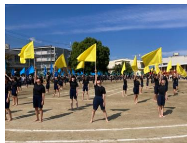
さすが6年生。南中ソーラン、一人技、フラッグの三部作。感動の表現です。