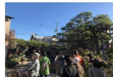
第12番札所 正念寺 樹齢350年の松が有名

【管外研修】 3.10 校区福祉委員会 阪神・淡路大震災記念 「人と防災未来センター」 最初に1.17シアターでは阪神・淡路大震災の再現映像を7分間見ましたが、あまりの迫力に皆さん顔が蒼白に。直下型地震の恐ろしさを改めて思い知りました。 その他、震災の記憶を残す貴重な資料や防災グッズの展示など、たいへん勉強になりました。コロナ禍で中止が続きました3年ぶりの研修でしたが、お天気にも恵まれ、充実した1日でした。