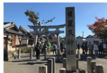
日置天神社 祭神菅原道真 8基の地車の倉庫

昨年11月25日(金) 第5回歴史散策は、招堤方面を巡りました。参加者は25名。枚方観光ボランティアガイドの説明を聞きながら、晴天の中約2.5kmの距離を歩きました。バス停を降りて、とうかえでの道を歩き「御堂池」を通り過ぎると立派なお寺「敬応寺」に到着しました。