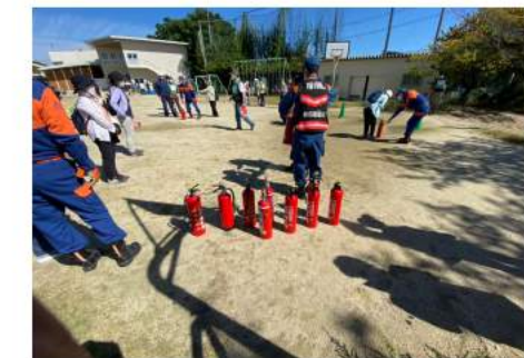
水消火器を使つて的を狙います

令和4年9月25日(日) 校区自主防災訓練を実施しました。コロナ禍のため久しぶりの訓練でしたが、それだけに皆さんの関心が高く、約200名の参加となりました。 体育館では避難所開設時