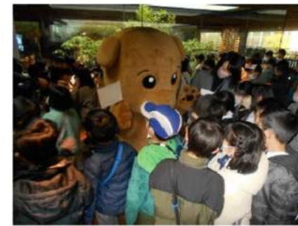
くらわんこのお出迎え

子どもたちの笑顔があふれた記念イベント 大ホールで開催した記念イベントでは、 ①学校の歴史や校区を紹介する記念動画の放映 ②校長先生による周年事業の報告 ③パナソニック パンサーズの選手や、ローガン市のエマウス校の児童たちから寄せられたお祝い動画メッセージの放映 ④打楽器奏者グループ・エトワールの皆さんによるコンサートなどが行われました。 児童はみんな、とてもリラックスしながらも集中してプログラムを楽しんでいました。