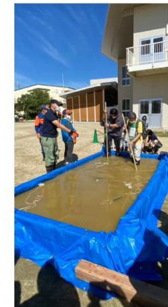
水中に潜む障害物を棒で探りながら歩きます

『水中歩行』では、わずか15〜20cmの浸水でも歩行困難になるという体験をしました。濁った水の中には様々な障害物があります。今回は訓練なので長靴を履きましたが、実際の避難時には紐をしっかりと締められる靴がお勧めです。