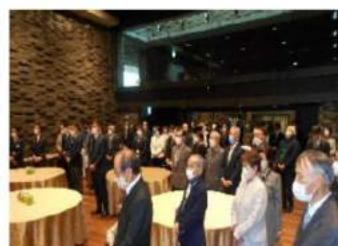
多くの方々にお集まりいただきました

枚方校区の皆様 令和5年2月24日枚方小学校創立150周年記念行事が事故無く無事に終了しました事を実行委員会より報告いたしますと共に、皆様方のご支援に対しまして改めて御礼を申し上げます。当日はあいにくの雨でしたが、「くらわんこ」が児童を迎え芸術センター内は児童の歓声で包まれ素晴らしい日の幕開けとなりました。以下の文章は当日の挨拶から一部抜粋したものです。ご一読下さい。