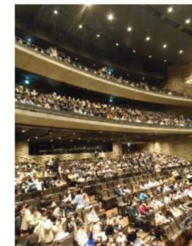
約1,000人の参加となる学校では実施できない大規模なイベントになった