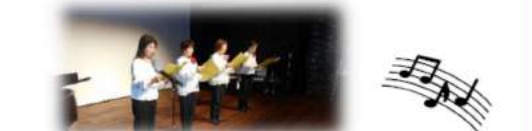
式典では地域で活動する方々によるピアノ演奏やコーラスも披露されました