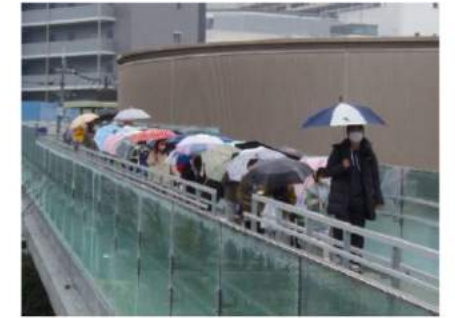
雨の中足元に気をつけながら

記念イベント当日は、あいにくの雨。児童は、先生方とPTAの皆さんに付き添われて、学校とセンターの間を歩いて往復しました。大ホールで開催された記念イベントには、児童約740人、児童の付き添いにご協力いただいたPTAの皆さん約100人、見学される保護者・来賓の皆さん等を含め、約1,000人が参加。学校内では実施できない大きな規模となりました。